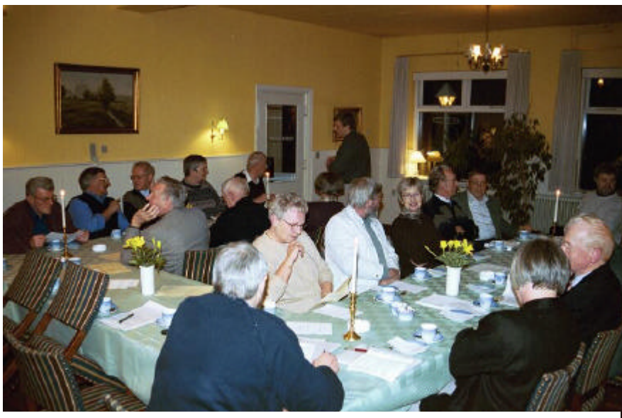
Fra generalforsamlingen på Gredstedbro Hotel 20. marts 2003.

"2002 har været et travlt år, med mange besøg på lokalarkiverne og afslutningen af projektet Mit liv i år 2000 som de væsentligste arbejdsopgaver. Især Mit liv i år 2000 må fremhæves, når jeg ser tilbage på det forgangne år. Som konsulent for Ribe Amts Lokal-